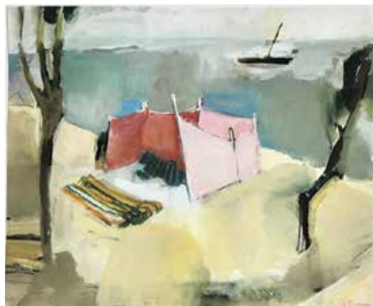
»Windzelt am Ahrenshooper Strand«, 1979

«Ich will ein Malweib sein, mit Empfindung und Farbe, mit Emotion und Intellekt»